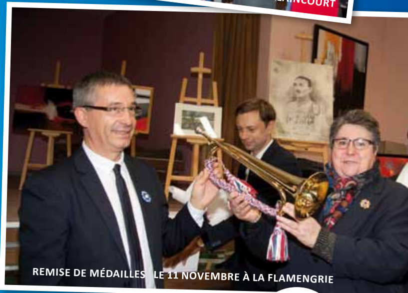
REMISE DE MÉDAILLES LE 11 NOVEMBRE À LA FLAMENGRIE