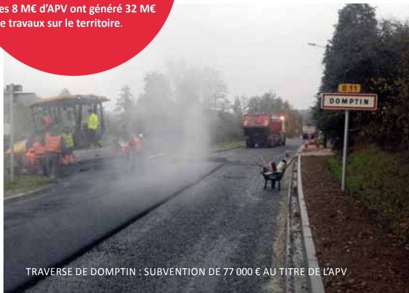
TRAVERSE DE DOMPTIN : SUBVENTION DE 77 000 € AU TITRE DE L'APV