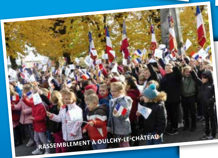
RASSEMBLEMENT À OULCHY-LE-CHÂTEAU