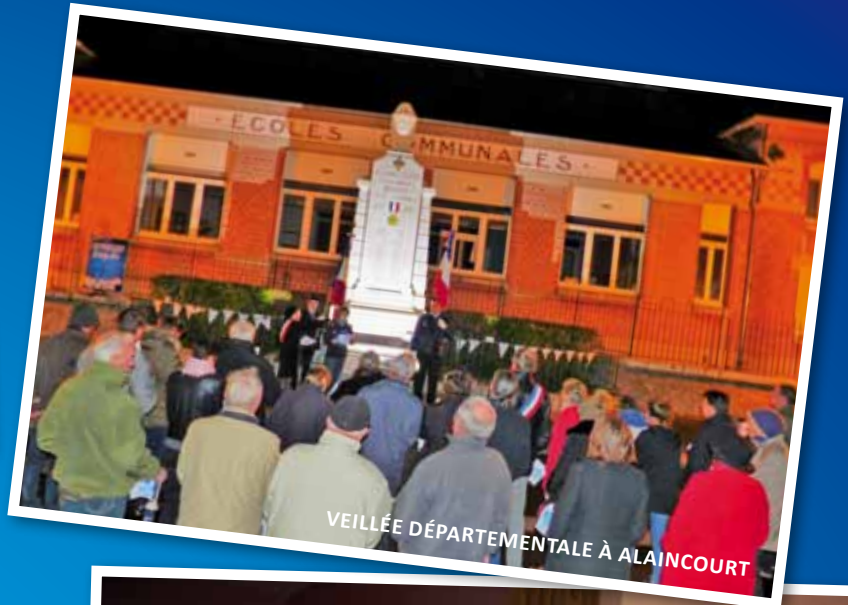
VEILLÉE DÉPARTEMENTALE À ALAINCOURT