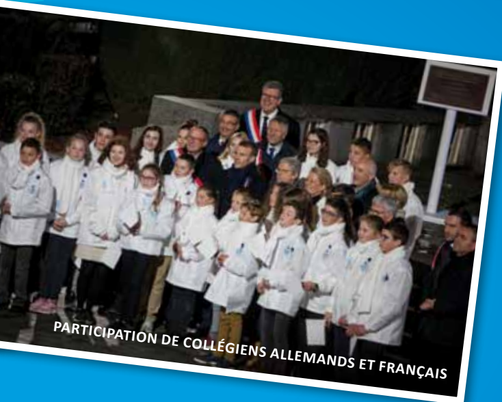
PARTICIPATION DE COLLÉGIENS ALLEMANDS ET FRANÇAIS