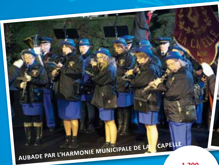
AUBADE PAR L'HARMONIE MUNICIPALE DE LA CAPELLE