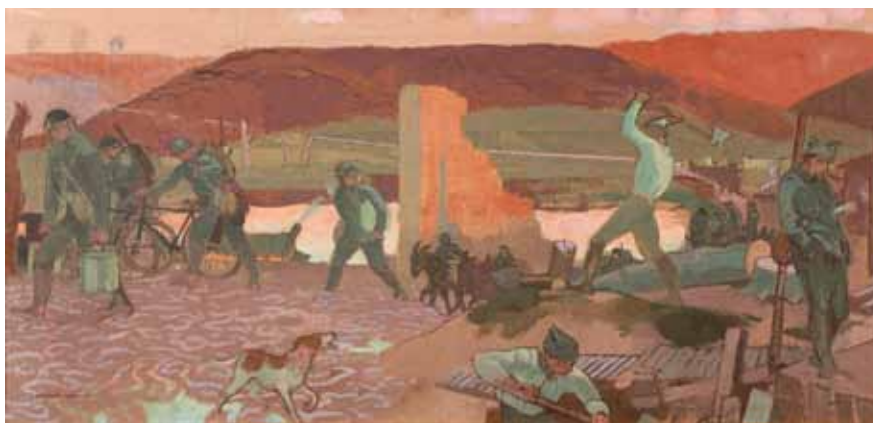
Maurice Denis - « Soirée calme en première ligne », 1917

fortifications. Au détour de la piste forestière, deux blockhaus bétonnés, à demi enterrés, sont tapis sous les feuilles mortes. L'un était un poste d'artillerie et l'autre un point d'observation pour les troupes allemandes.