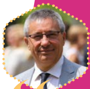
NICOLAS FRICOTEAUX, Président du Conseil départemental de l'Aisne

Le Relais de la Flamme est une occasion unique de mettre en valeur les richesses humaines, patrimoniales et naturelles de notre département. Ce sera également un grand rassemblement festif et, tous ensemble, nous célébrerons le passage de la Flamme qui annonce l'ouverture des jeux! Nous serons tous mobilisés pour que le pays vibre au rythme des jeux. Ce sera un grand moment de fraternité!