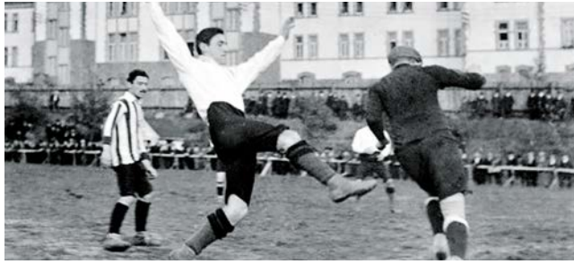
Julius Hirsch en 1912