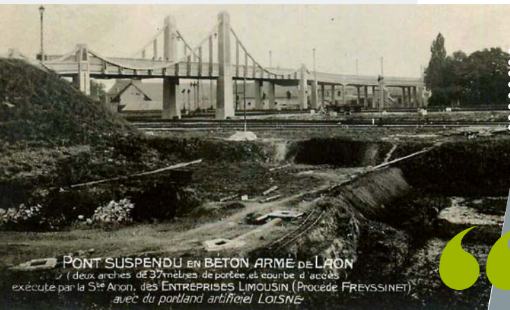
PONT SUSPENDU EN BÉTON ARMÉ DE LAON (deux arches de 37 mètres de portée, et courbe d'accès) exécuté par la S te Anon, des ENTREPRISES LIMOUSIN (Procédé FREYSSINET) avec du portland artificiel LOISNE