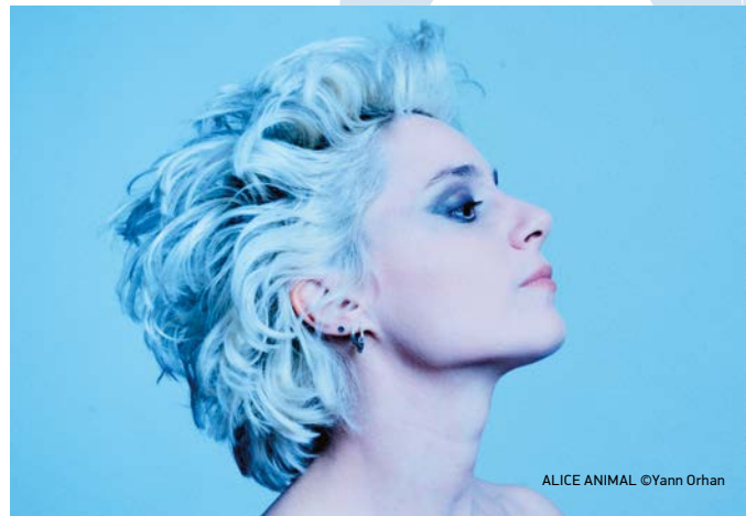
ALICE ANIMAL