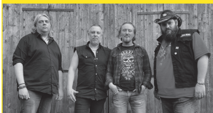
BLACK RIVER SONS