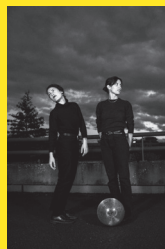
ADIEU AU DANCING

Samedi 24 septembre - 20h - La Biscuiterie Festival C'est Comme Ça ! ADIEU AU DANCING