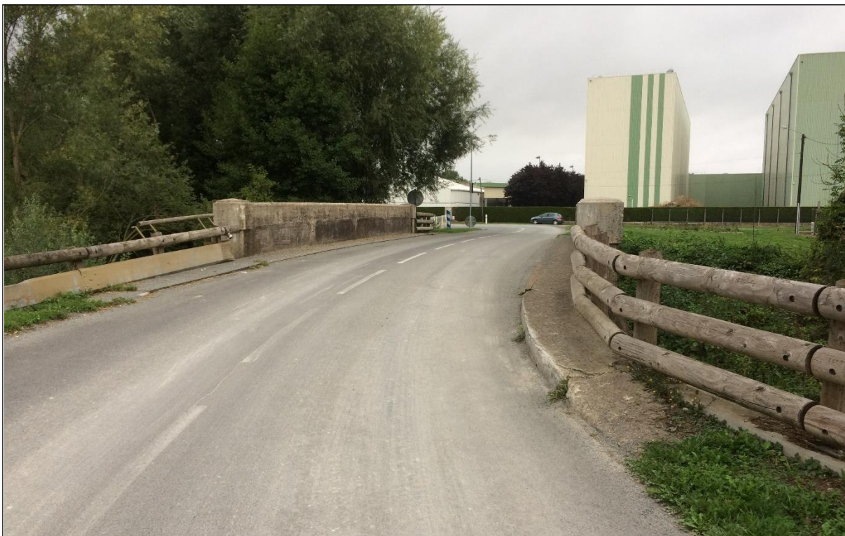
L'ouvrage d'art n°D0182 a été construit en 1927.

Dans un état structurel dégradé, le pont permettant le franchissement du cours d'eau le Vilpion à Marle par la RD58 va être complètement remplacé à partir du lundi 6 novembre 2023