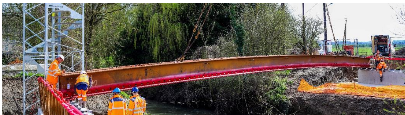
Pose des poutrelles du futur ouvrage

Les travaux du nouveau pont sur le Vilpion, débutés en novembre dernier, avancent selon le planning. Les nouvelles poutrelles du futur ouvrage ont été posées.