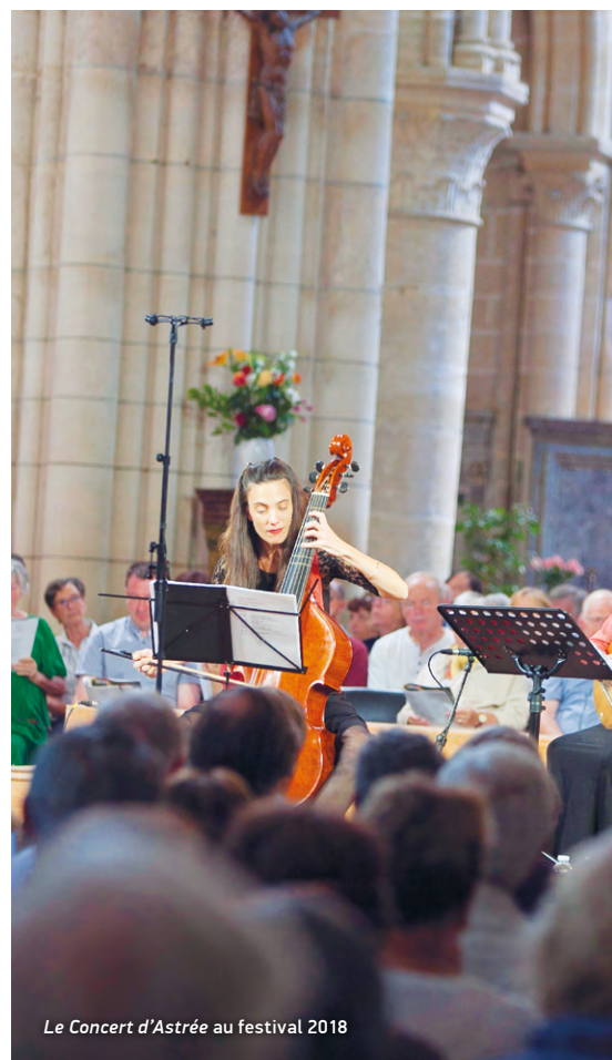
Le Concert d'Astrée au festival 2018