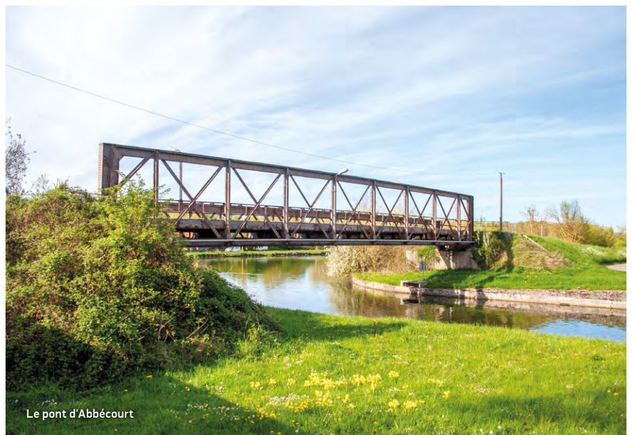
Le pont d'Abbécourt

Dans son premier diagnostic, le CEREMA a estimé qu'une limitation à 3,5 t s'imposait. La commune a débloqué les fonds pour lancer les premières études et un dossier de demande de subvention auprès du Cerema est en cours. Avec un seul financement, la Commune pourra difficilement supporter le coût de ces travaux. Elle attend le nouveau règlement APV du Département et espère un soutien de l'État.