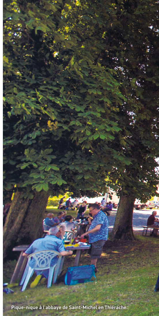
Pique-nique à l'abbaye de Saint-Michel en Thiérache.

Impossible d'évoquer les 40 ans du festival sans revenir à la journée historique du 8 juin 1987 . Ce jour-là, l'ADAMA et Radio France affrétaient un convoi spécial, un train depuis la gare du