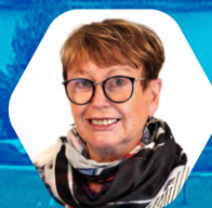
Colette Blériot , vice-présidente du Conseil départemental de l'Aisne, Sport et Terre de jeux