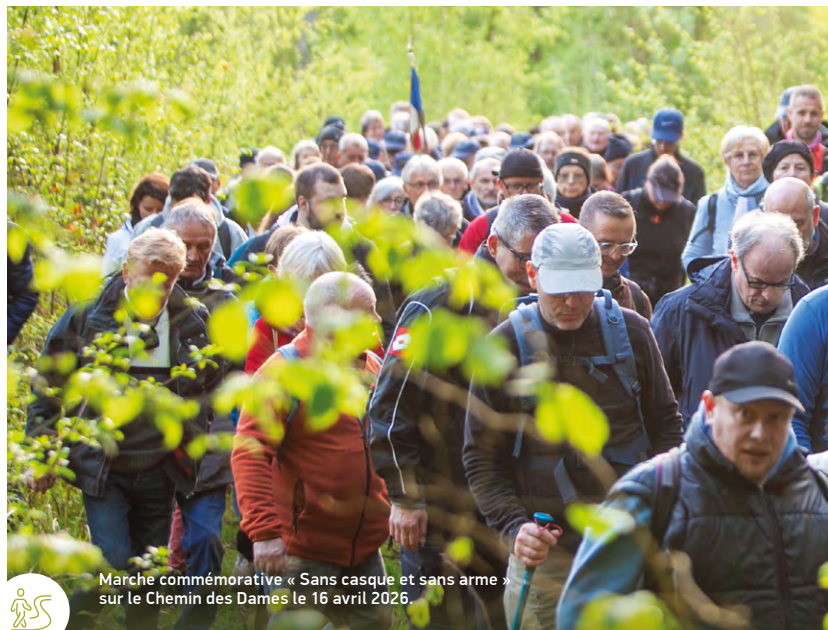
Marche commémorative « Sans casque et sans arme » sur le Chemin des Dames le 16 avril 2026.

..... Tout savoir sur le Chemin des Dames https://www.chemindesdames.fr/fr