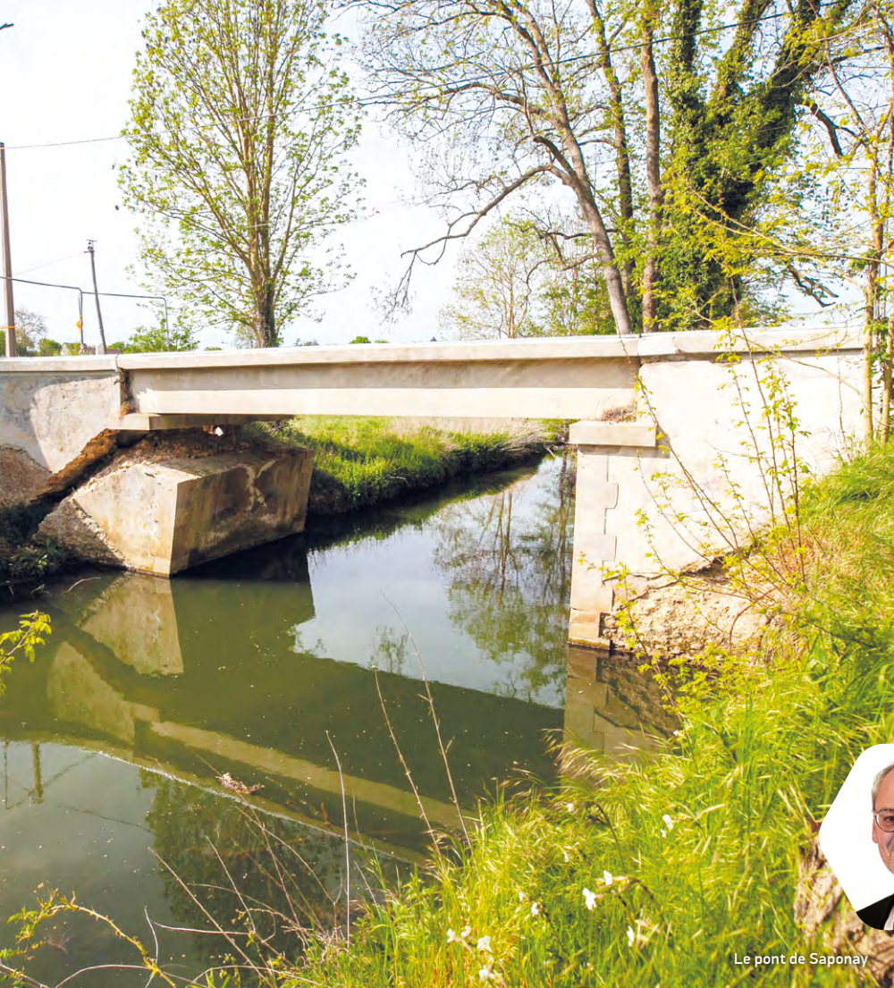
Le pont de Saponay