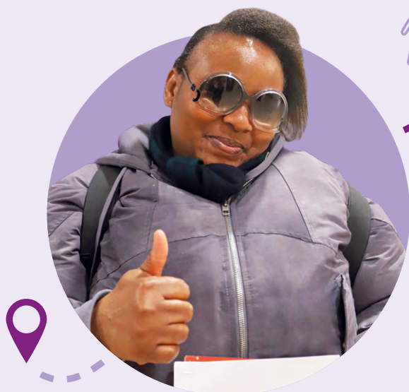
L'or, 44 ans, Laon

« Actuellement au RSA, je suis suivie par la Mission Locale pour passer mon code. Je suis allée au salon « Trouve ton job » pour postuler pour des missions de ménage , mais en attendant je peux donner de mon temps pour les personnes âgées ou les enfants. Quand j'ai reçu un SMS de Aisne-actifs au sujet des Rencontres du bénévolat, je me suis tout de suite inscrite ! J'aimerais lire des histoires dans les écoles ou discuter avec les seniors. »